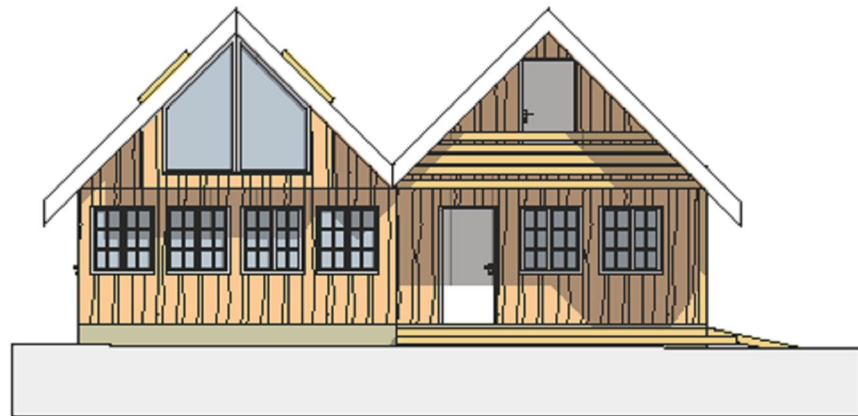
1:100 Fasade Vest