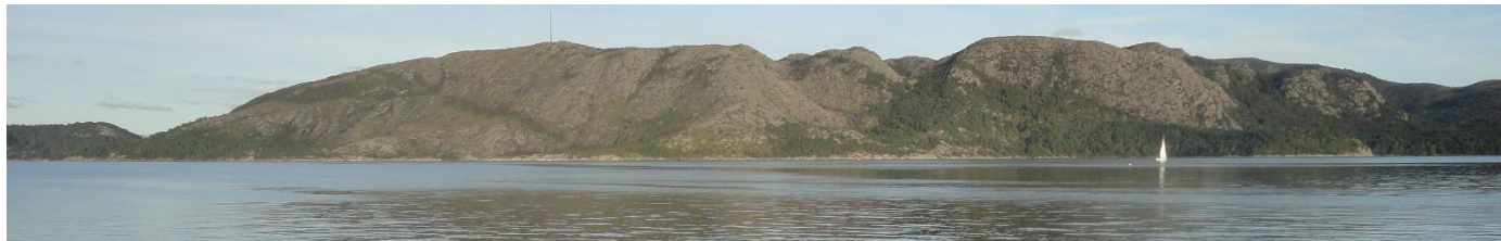
Lifjellet, Gandsfjorden, frå Jåttåvågen.